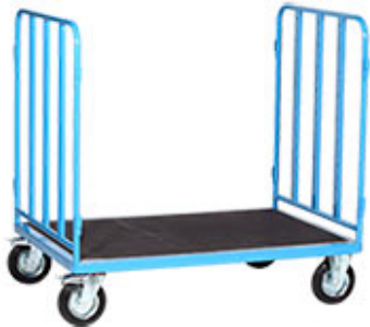
Basisversion in niedriger Ausführung

Individuell im System: Paketwagen und Etagenwagen